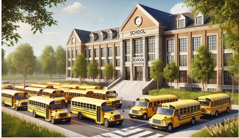
1. ábra. Újra buszos kirándulás.

Az iskolai kirándulás sikeréhez nem elég, hogy mindenki felférjen a buszra! Gondoskodni kell enni- és innivalóról is.