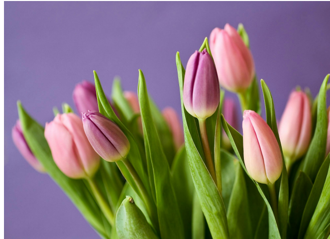
1. ábra. Tulipáncsokor.

Tudtad...? A tulipánok olyan értékesek voltak a XVII. században, hogy gazdasági jelentőségük is volt. Tulipánmánia - voltak hagymák, amik többet értek, mint a házak.